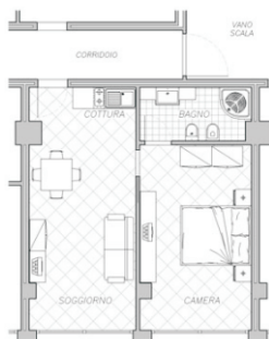
Appartamento CORALLO 2/6 posti - 44 m 2