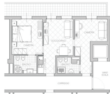
Appartamento NINFEA 2/6 posti - 50 m 2