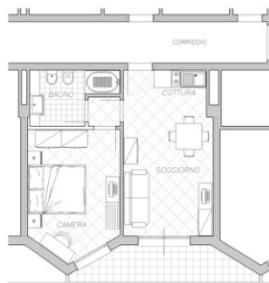
Appartamento NINFEA 2/4 posti - 39 m 2