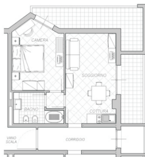
Suite STELLA MARINA 2/4 posti - 39 m 2